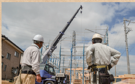
木工事請負(建築全般)