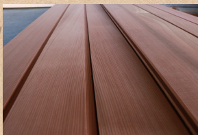
ベイスギ Western Red Cedar