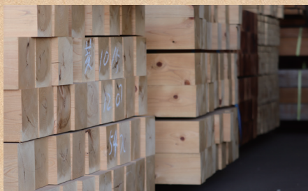
建築資材の流通販売