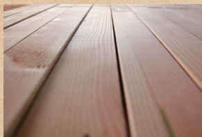
ベイマツ Douglas Fir