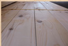
オウシュウトウヒ White wood