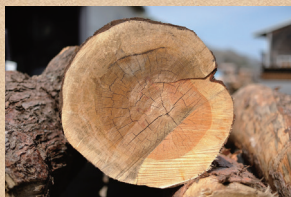
信州カラマツ Shinsyu Karamatsu