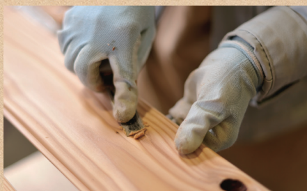
長野県産材製品の加工・販売