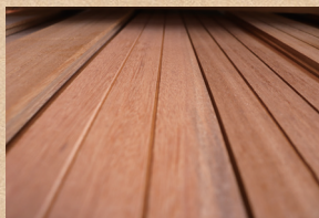
セランガンバツ Selangan batu