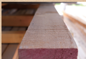
ベイヒバ Yellow cedar