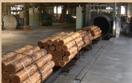
防腐・防火処理木材製品の製造・販売