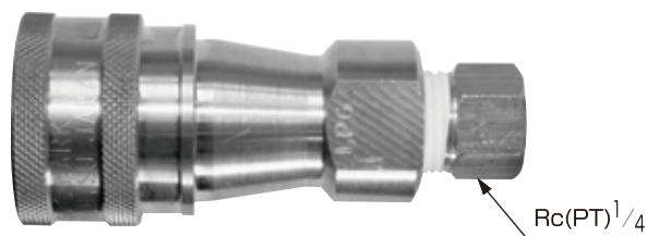
IC-3R メネジRc1/4ジョイント付