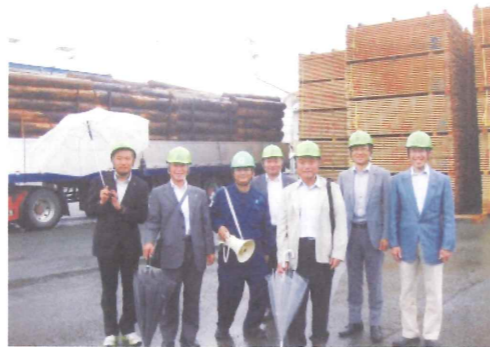
視察中の大原議員 右より3人目