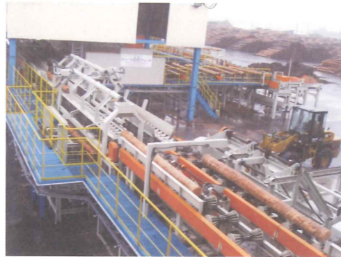
広大な敷地に機械化が進む木材加工工場

木質バイオマス活用についてアンケートや導入シミュレーションを行った結果、安定供給や採算性など課題が多いことが分かった。市民生活を支える森林の多面的機能を維持するためにも森林資源を循環させ有効利用しながら供給可能な木質バイオマスの利活用についても検討していく。