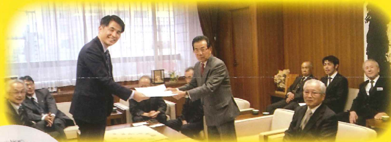
福岡市への陳情に同行