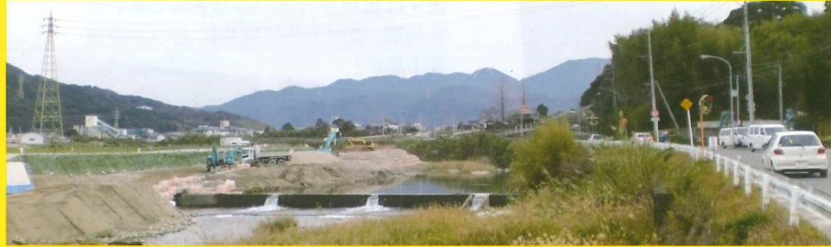
県議在任中からの懸案だった県道内野次郎丸弥生線 西入部町内室見川沿いの300m道路拡幅。着々と進行中。地元の熱意で28年の完成予定。

地域のみな様からの年間100件におよぶ陳情・相談。 市議は勿論、県議時代の人脈で連携を図りながら充実した生活環境を整えるために 共に頑張っております。