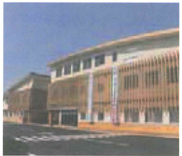
全国で初めて木造で建築された熊本県上天草市の3階建て庁舎 ほぼ全量を地元天草で賄った

我が国は国土の70%(福岡市33%)を森林が占める森林資源国です。このところ森林や木の心身に与える良い影響が再認識され、森林に親しむイベントや木材を利用する試みが全国で行われるようになりました。福岡市に於いてもこれからもっと森林・木材を資源として再認識し有効活用されることを望みます。