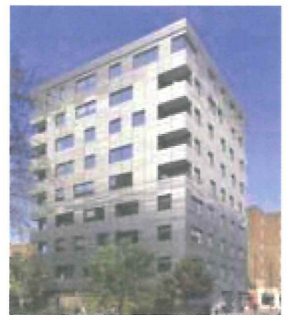
板を重ねた集成材を用いて英ロンドンに建設された9階建て集合住宅