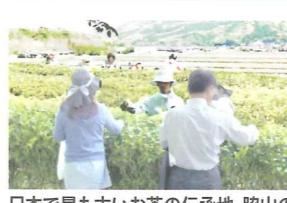
日本で最も古いお茶の伝承地、脇山の茶畑で園児たちと一緒に茶摘み。