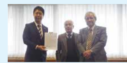
高島市長に要望書を手渡す地域代表

そこで数年前、早良区選出の自民党市議4名が結束し早良区自治連合会などからの後押しを受け担当局や執行部に何度も足を運び要望活動を行いました。昨年ようやく高島市長に要望書を手渡すことができ6年度予算に調査費が計上されました。