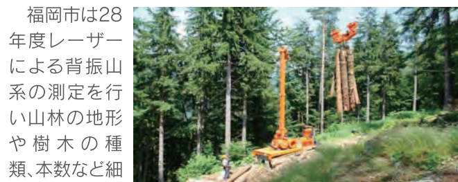
機械化が進んだ作業

欧州では木材が部材だけではなく、CLT(直交積層材)に加工され軽くて強度や断熱性に優れ工期も短いことからコンクリートを殆ど使わないCLTの高層ビルが建ち始めています。2020年開催の東京オリンピックのメインスタジアムもこの木材加工技術が取り入れられるのではないのでしょうか。