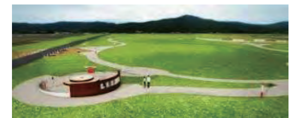
整備が進む吉武高木遺跡(イメージ)と出土品

生活交通の確保はますます重要性が高まっていくと考えている。地域の声や議会の意見を聞きながら総合的に生活交通の確保に努めていく。現在、脇山支線の見直しと西地区へのデマンド交通システム導入が検討中です。