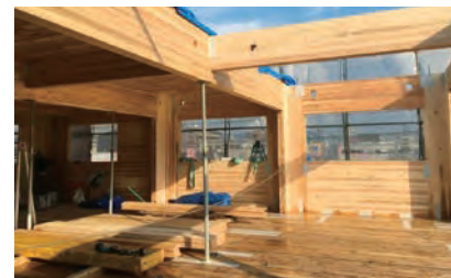
国内でもCLTを利用した建物が建設されています。写真は福岡県初のCLT工法で那珂川町に建設中の社屋。

林業先進国の視察を終え、林産業の活性化は勿論、森林のもつ公益的機能の維持・増強による地域発展に資するためには現状を見直し行政と森林組合、森林所有者が協力・協働で取り組むべきではないかと考えています。