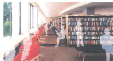
図書館分館(開架コーナー)