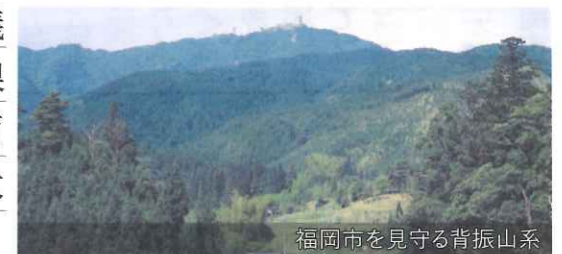
福岡市を見守る背振山系

森林資源は、大切な地域資源であり、林業活性化は地域の再生にもつながっていくと考えている。森林の有する多面的機能の発揮を図るとともに、都市型林業の創造に努めていく。