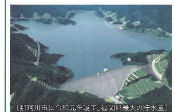
〔那珂川市に令和元年竣工、福岡県最大の貯水量〕