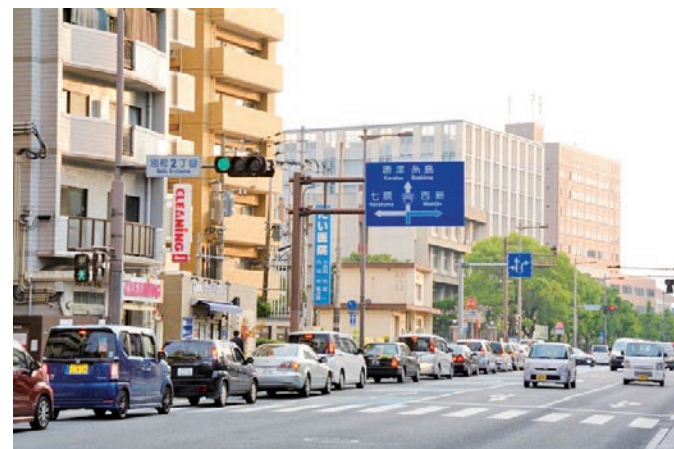
混雑する中村学園前

中村大学前交差点は国道202号と城南学園通りとが交わる交差点です。下り線は交差点手前で直進2車線から1車線になることから、無理な車線変更により交通事故が頻発しています。交通事故減少と不便性解消を図るために、①中村大学前交差点下り線(荒江方面へ向かう車線)の直進2車線化、②自転車専用道路の新設の二つの事業計画が決定しました。