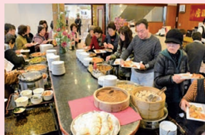
海を見ながらあれも・これも・それも!! (ランチバイキング)

9月5日(火)、9月27日、11月27日(月)と、3回に分けて予定しております。