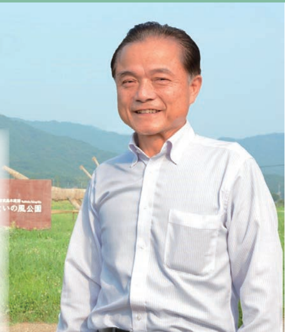
吉武高木遺跡やよいの風公園にて

木遺跡があります(写真上)。その古い歴史を物語る遺跡や言い伝えが数多く残っています。しかしながら時代の流れが進むにつれて埋もれていってしまうような気がしています。 博多の榎田神社より古いとも言われている早良区野芥の榎田神社でも夏の大祭が行われました。この祭りは、締込み法被姿の若衆が夜の帳の中を赤と青一対の大きな獅子頭を持って無病息災と繁栄を祈願しながら氏子の家々を威勢よく回る祭りです。観衆がいるわけではなく派手さはありませんが、何百年と氏子たちによって引き継がれた祭りだけあって威厳を感じさせられます。大人がやっているのは今では野芥の榎田神社だけのようです(写真左)。 ユネスコとまではなくても、子どもたちに残していく、また引き継いでいかなければならない有形・無形の文化遺産が私たちの足元にいろいろあるのではないかと感じます。