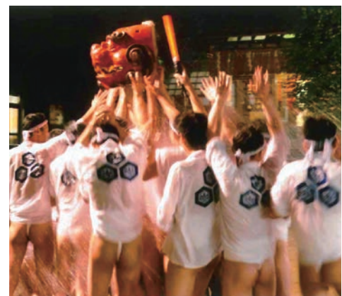
野芥榎田神社の夏祭り