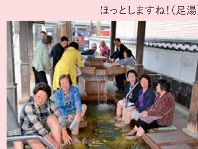
ほっとしますね!(足湯)