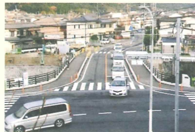
完成した内野大橋

架け替え工事の内野大橋が昨年末に完成しました。平成31年度に城の原橋の架け替えが完成するころには計画の全工事が終了する予定です。