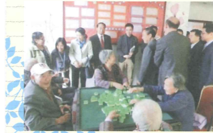
広州市立老人ホーム視察