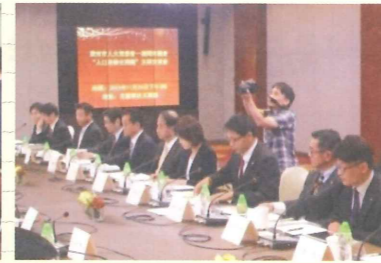
超高齢化対策意見交換

広州市 中国広東省にあり人口1293万人(2013年)。面積7434km 2 。北京、上海に次ぐ中国第3位の都市。経済・文化・教育・交通などの中心都市の一つ。