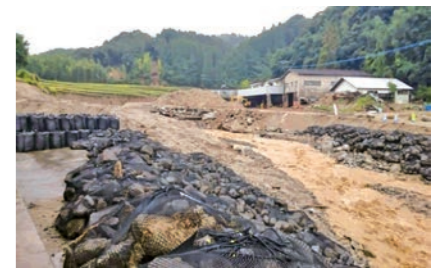
被害の大きい朝倉市松末小学校周辺

福岡市では直後から消防局、水道局の緊急車両、ヘリコプター、給水車等の車両と共に職員を派遣し調査、救助、連絡等の支援を行いました。また、ボランティアバスを運行、多くのボランティアも現地に赴きました。住宅の提供や土木技術職員の長期派遣等支援を継続中です。