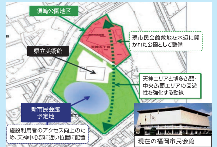
施設利用者のアクセス向上のため、天神中心部に近い位置に配置

中央区須崎公園横の市民会館は長く市民の文化・芸術活動の拠点となり、多くの市民から親しまれていましたが55年を経過し老朽化が進んだことから建て替えられることになりました。新市民会館は県立美術館の南側に総事業費200億円で建設予定。大ホールの他、演劇に適した中ホール、小規模交流ホールなどを整備する予定。2023年の開館を目指しています。