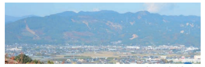
多くの爪痕が残る山々

九州北部地域7月5日～6日の総降水量は500ミリを超えました。例年の7月1ヵ月の降水量を超え、朝倉市や日田市で24時間降水量が観測史上1位の値を更新するなど記録的な大雨となりました。12月末に行方不明者の遺体が久留米市河川敷で発見され、この豪雨での死者は39人、不明2人と甚大な被害をもたらしました。