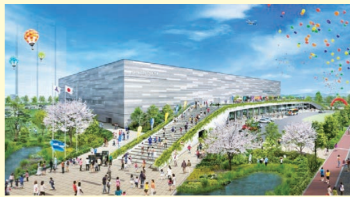
福岡市総合体育館完成予想図

福岡県庁横にある市民体育館は老朽化のためアイランドシティ内に福岡市総合体育館として生まれ変わります。新しい総合体育館は4階建て。メインアリーナだけを見ても市民体育館の2倍以上、バレーボールだと4面、一般の卓球だと48面もとれる広さですから驚きです。観客席も約1.5倍の5000席。ほかにサブアリーナ、武道場、弓道場、多目的室など。熱戦を繰り広げるアスリートたちの熱い息づかいが聞こえてきそうです。