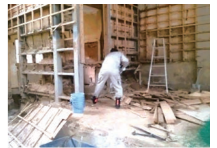
松末小学校体育館内

大量の土砂で校舎が埋もれてしまった松末小学校は閉校せざるを得ないとのことでした。せめて、卒業式と閉校式を体育館でさせてあげたいと地元青年会議所が中心となって改修工事が行われています。それには先ず体育館を埋め尽くした土砂を取り除くことが必要でした。私たちは重機で作業ができない更衣室やトイレの土砂の掻き出しをしました。スコップの先の土砂から笑顔で写った子どもたちの写真が何百枚も出てきたときは、しばらくスコップを動かすことができませんでした。自然の惨さを感じさせられました。