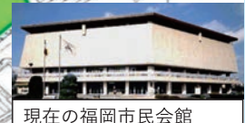
現在の福岡市民会館