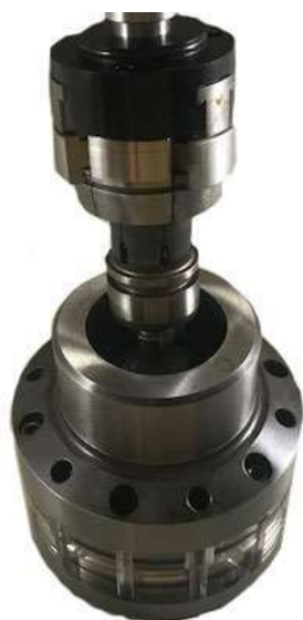
コレットをローダーまたは、口ポットにて本体挿入する