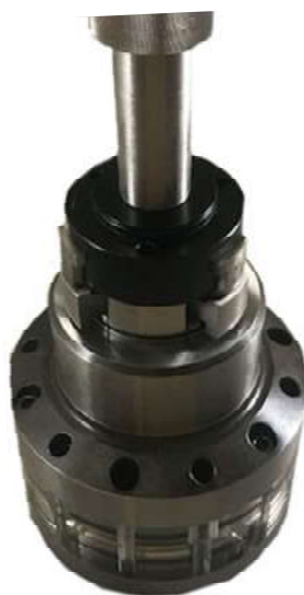
60° 旋回しパイヨネット構造とメインピストンと噛み合い本体取付完了