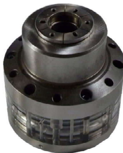
サブピストンのパイヨネット廻り止め部、メインピストン挿入し固定完了