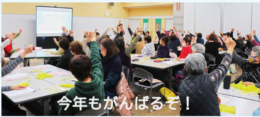
今年もがんばるぞ！