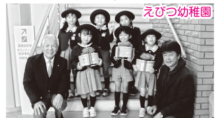
大切な募金を届けてくれた かわいい園児のみなさん