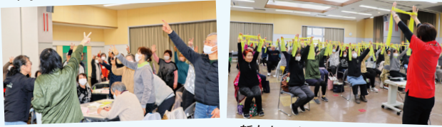
新たなエクササイズを習得！！