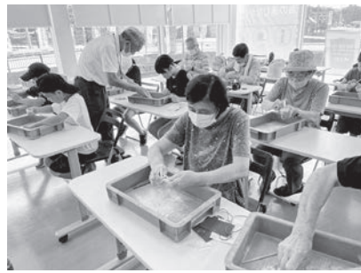
海の道むなかた館での体験活動。みんな真剣！