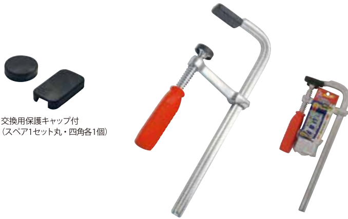
交換用保護キャップ付 (スベア1セット丸・四角各1個)