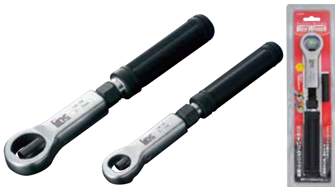
バックサイズ LB-1N : W85×H310mm LB-2N : W95×H358mm