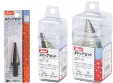
ST-1.2 ST-3 ST-4

バック・ケースサイズ ST-1・2:W50×H140mm ST-3 :W40×H130mm ST-4 :W55×H130mm