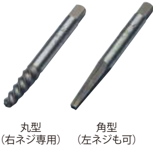
丸型 (右ネジ専用) 角型 (左ネジも可)