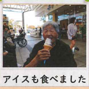
アイスも食べました