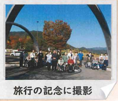
旅行の記念に撮影