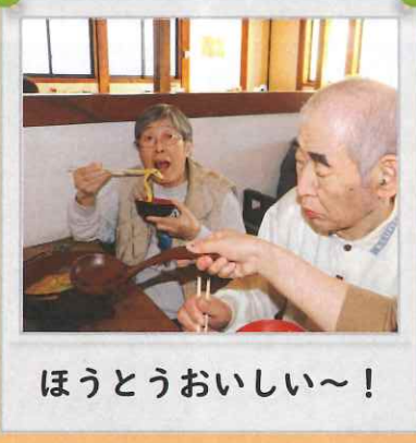
ほうとうおいしい～！