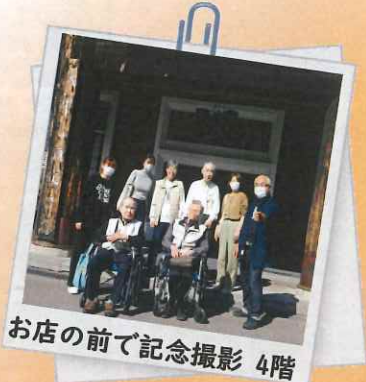
お店の前で記念撮影 4階

令和5年11月2日（木） 日帰り旅行で山梨に行きました。 昼食にほうとうを召し上がり、 旅行中笑顔で楽しめました。