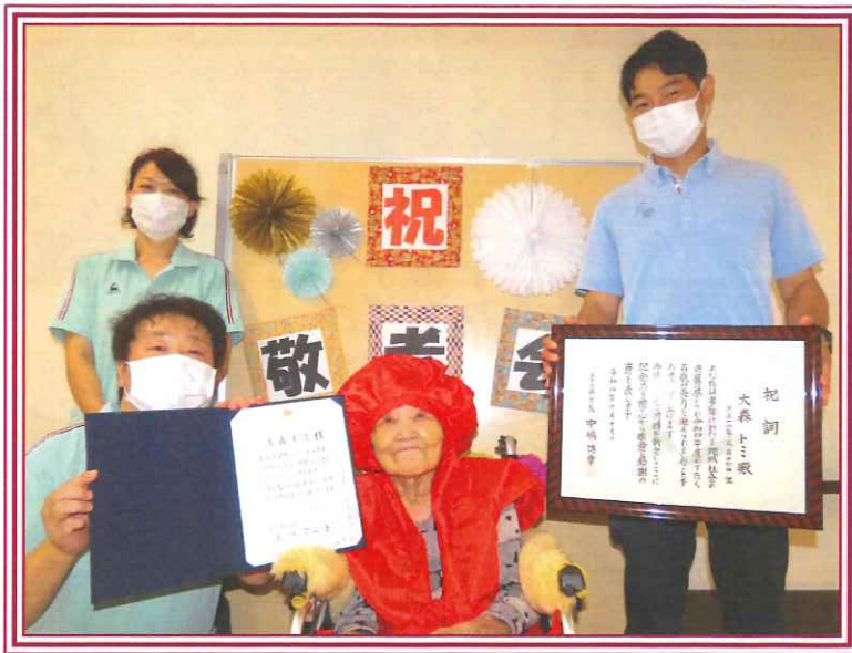
東京都とあきる野市から 100歳のお祝いをいただきました

今年には白寿2名、米寿4名、喜寿4名の方に居室担当からのメッセージカードを読み上げ、記念品とともにお渡しし、利用者皆様のご長寿をお祝いしました。 今回は納涼祭で練習した『三百六十五歩のマーチ』の体操や紅白旗揚げゲームなど一緒に身体を動かすアトラクションで大いに盛り上がりました。