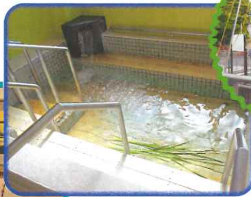
菖蒲湯で無病息災