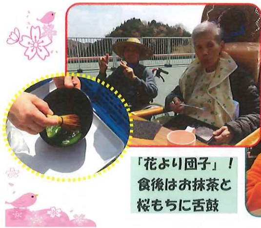
「花より団子」！ 食後はお抹茶と 桜もちに舌鼓