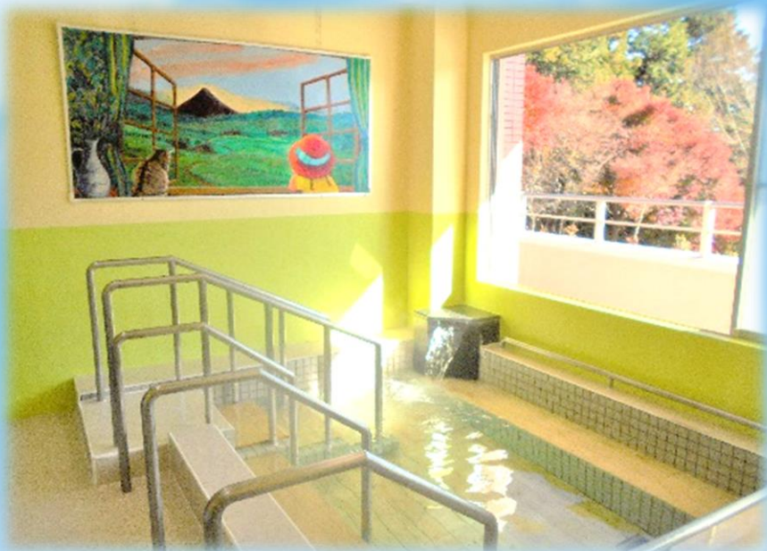
共同浴室には絵画が飾られ 浴槽内にはヒノキを敷いています