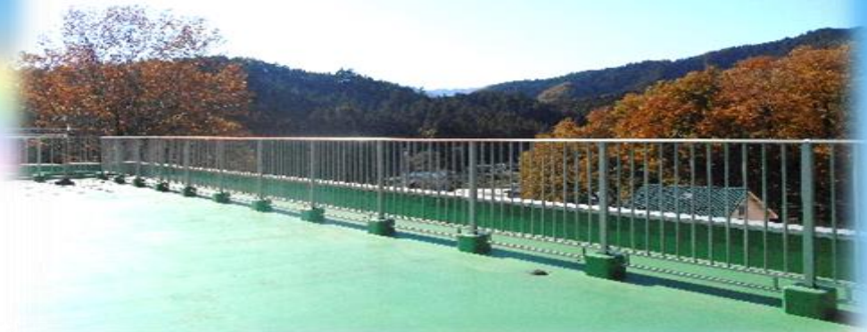
屋上からはあきる野市の 四季折々の景色が望めます