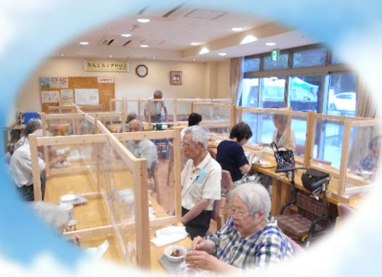
食堂でのお食事は暖かく 冷たいままでご提供いたします