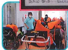
有事に備えて訓練中！