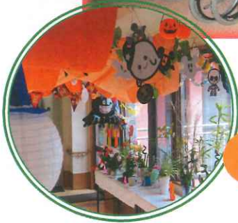
ハロウィン 準備中〜