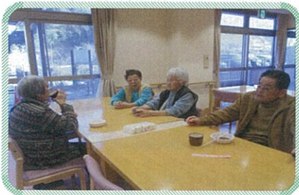
おいしいお汁粉と甘酒で お正月気分にも一区切り…

年明けは11日に鏡開きを行い、お汁粉と甘酒を楽しみました。今年も利用者様に喜んでいただけるよう、頑張つていきます。