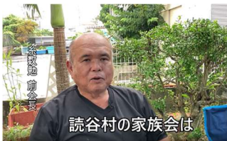
読谷村の家族会は