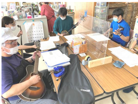
楽器は各自持ち寄り。ギターの人もいるようですが・・・(いつもは三線を持ってきています)

参加者は幅広く、まったくの初心者という人もいれば、「伝統芸能選考会」で新人賞入賞という腕前の人もあります。いつかクリスマス会や忘年会などでお披露目できるようになることを目標に、いまは安波節 あはぶし や安里屋 あさとや ユンタなどの定番曲を練習中。