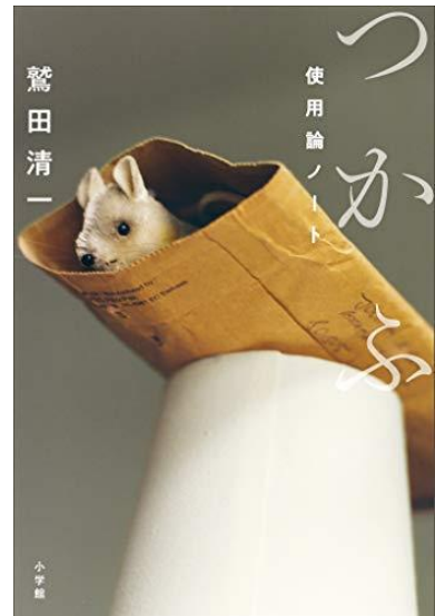
『つかふ 使用論ノート』 鷺田清一著(小学館)

たとえば人や地域がもともと持っていた機能は、公共のサービスを得ることで置き換わり、拡張される。ただし同時に退化を招くことも否めない。