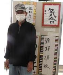
【ふれあいプラザ宮古 荻野・下地】