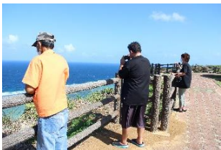
写真撮影会の様子