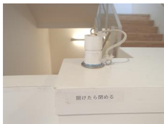
階段踏み場ドアストッパー