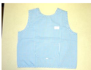
クッキング用エプロン