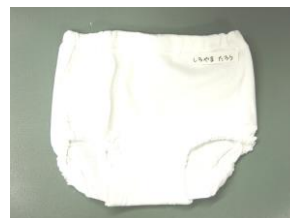
パンツ *必要になりましたら個別 にお知らせします。