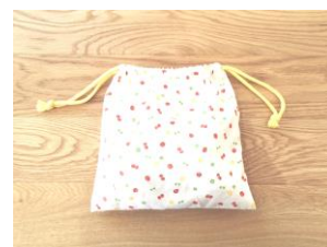
クッキングセット袋