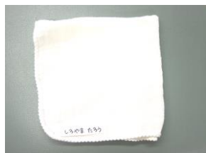
授乳用ガーゼ (*0歳児のみ)