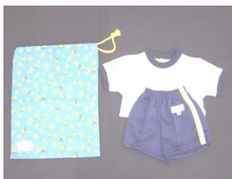
体操着袋・体操着

④体操着（半袖白Tシャツ・半ズボン。寒い時はトレーナー等で調節します。）を着用しますが、体を締め付けず伸縮性のある動きやすい物を用意してください。また、専用の体操着袋に入れて下さい。