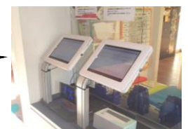
（登降園管理システム（タッチパネル））