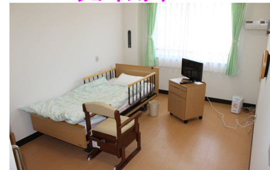
ゆったりと落ち着く個室