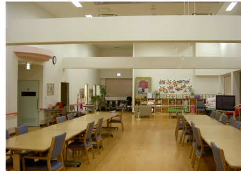
広々としたテイルーム