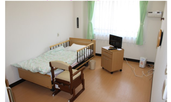
ゆったりと落ち着く個室