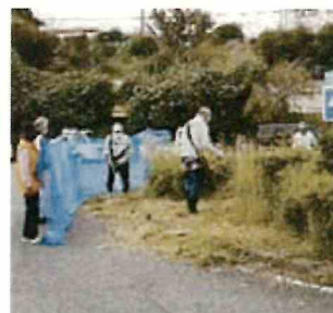
飛散防止ネットをして作業