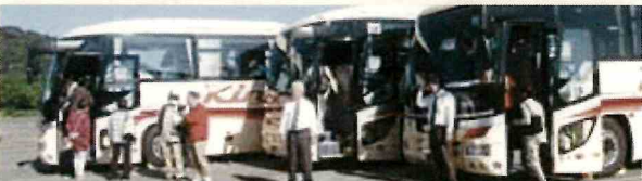
大山田PAに集結し3台揃って出発