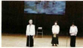
詩吟くらぶ同好会