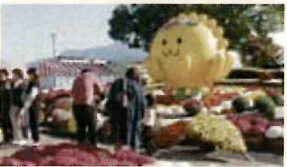
マスコット「きくりん」