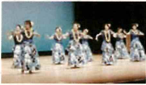
フラダンスサークル