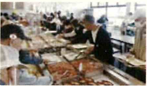
取りすぎてしまうバイキング

昼食は海鮮を中心としたバイキングと地ビールの飲み放題を楽しみ、名物のジャンボエビフライを食べて、お腹が一杯になりました。その後、越前市に向かい、日本三大菊人形の一つ「たけふ菊人形」に行き、大河ドラマ「光る君へ」をテーマにした人形や千本菊など迫力ある菊を観ました。園内を散策した後、近くの「越前そばの里」で新そばの試食・そばソフトクリームを食べお土産を買って帰路につきました。車中ではビンゴゲームなどをして過ごし、来年も参加したいと思えました。