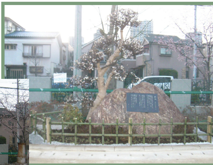
記念樹植栽竹垣設置工