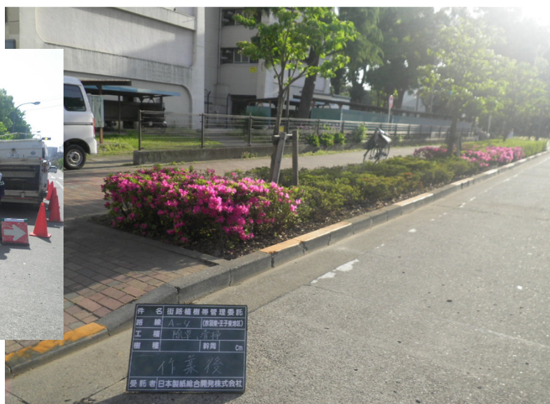
街路植樹帯管理業務