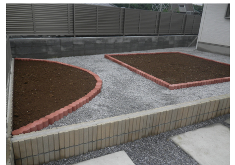
個人庭園樹木撤去