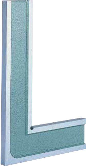
1級 (焼入) 2級 (焼入)