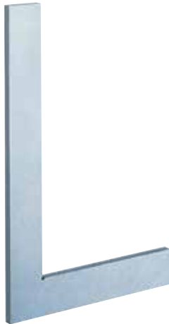
■寸法図 (概略) 単位: mm

・1級は全種焼入、2級は非焼入品にて製作しています。 算式 1級 \pm (10 + \frac{\ell}{20}) \mu m 2級 \pm (20 + \frac{\ell}{10}) \mu m \ell = 呼び寸法