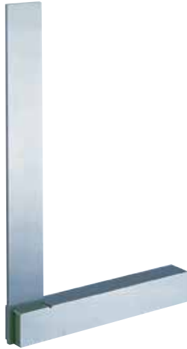
1 級 (焼入) 2 級 (焼ナシ)