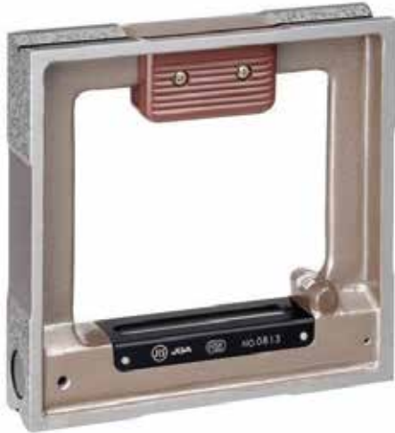
JIS A 級