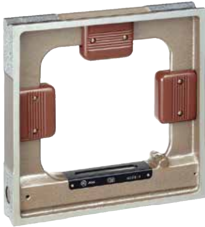
JIS A 級 AA (社内規格)