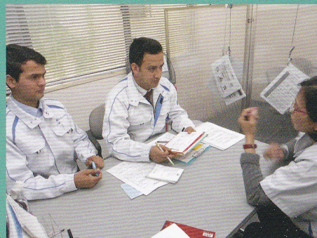
派遣先のご要望・仕様をヒアリング