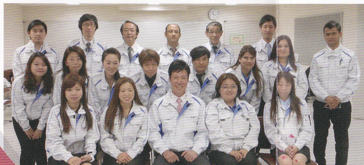
わたしたちにお任せください!

求人広告のコスト、労務管理の手間、すべて不要。 人件費のトータルコストを削減します。