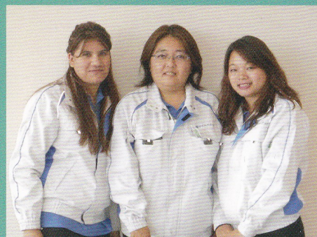
各国のバイリンガルスタッフ(採用・教育担当)